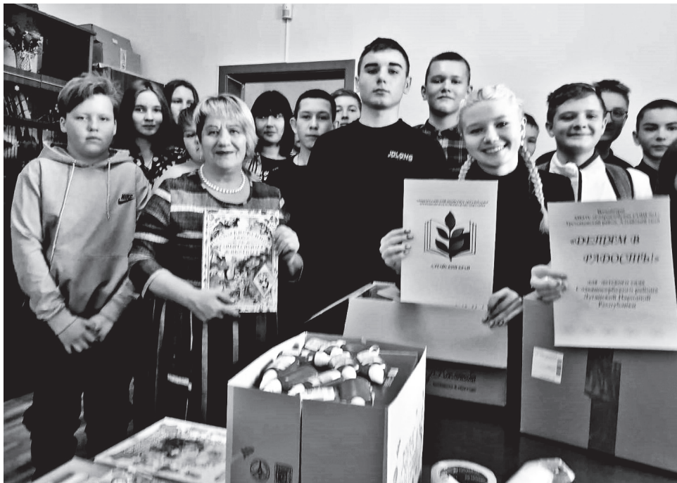
Участники акции «Детям в радость» из Третьяковского района