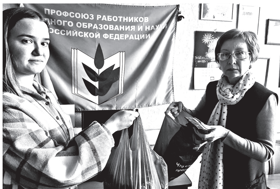
В акции участвует профком АлтГПУ