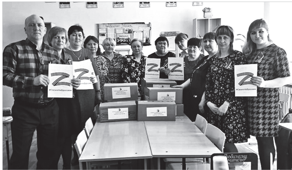
Профсоюзный актив Баевской районной организации

Профсоюзные организации работников образования Алтайского края участвуют в гуманитарных акциях, чтобы поддержать солдат и их семьи