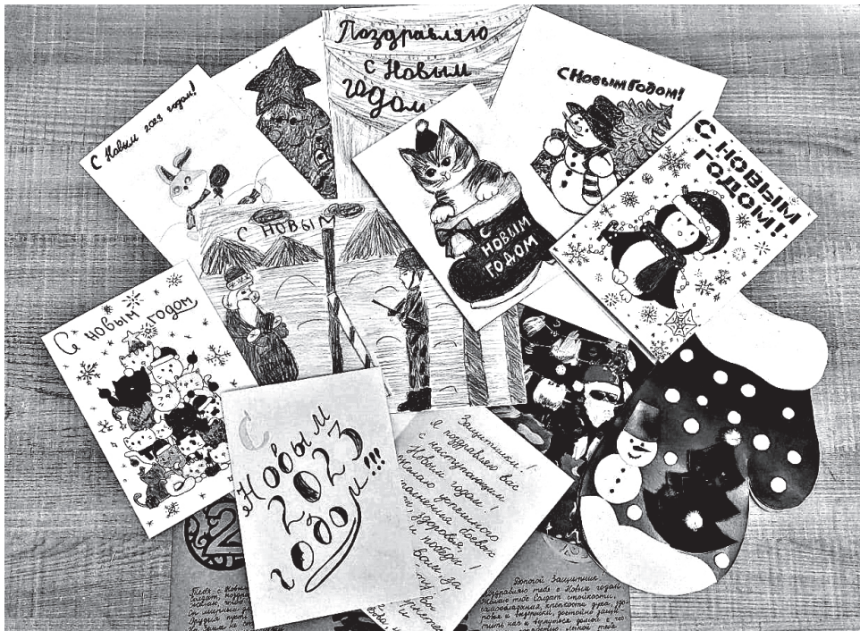
Письма от учащихся Родинского района

юза Галина Денисова . – Позиция – нас это не касается – неправильная. Если есть возможность помогать, то это необходимо делать».