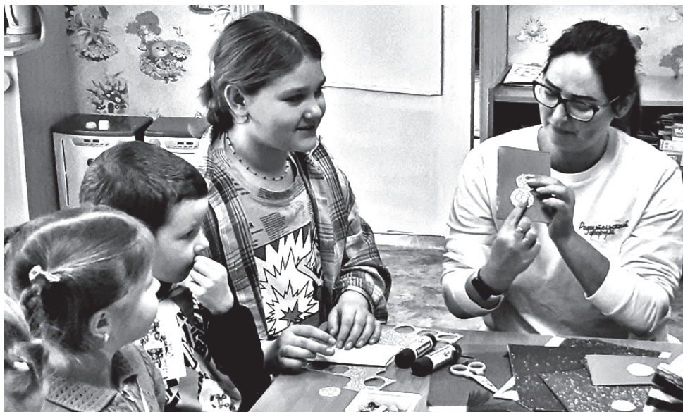
Акция в Озимовской школе Поспелихинского района